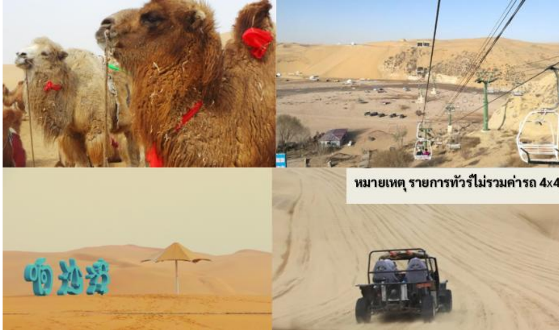
หมายเหตุ รายการทัวร์ไม่รวมค่ารถ 4x4

บริษัทฯ จึงไม่สามารถคืนค่าใช้จ่ายในส่วนนี้ได้ และต้องขอภัยในความไม่สะดวกมา ณ ที่นี้ และหวังเป็นอย่างยิ่งว่า ท่านจะเข้าใจในมาตรการเพื่อความปลอดภัยดังกล่าว